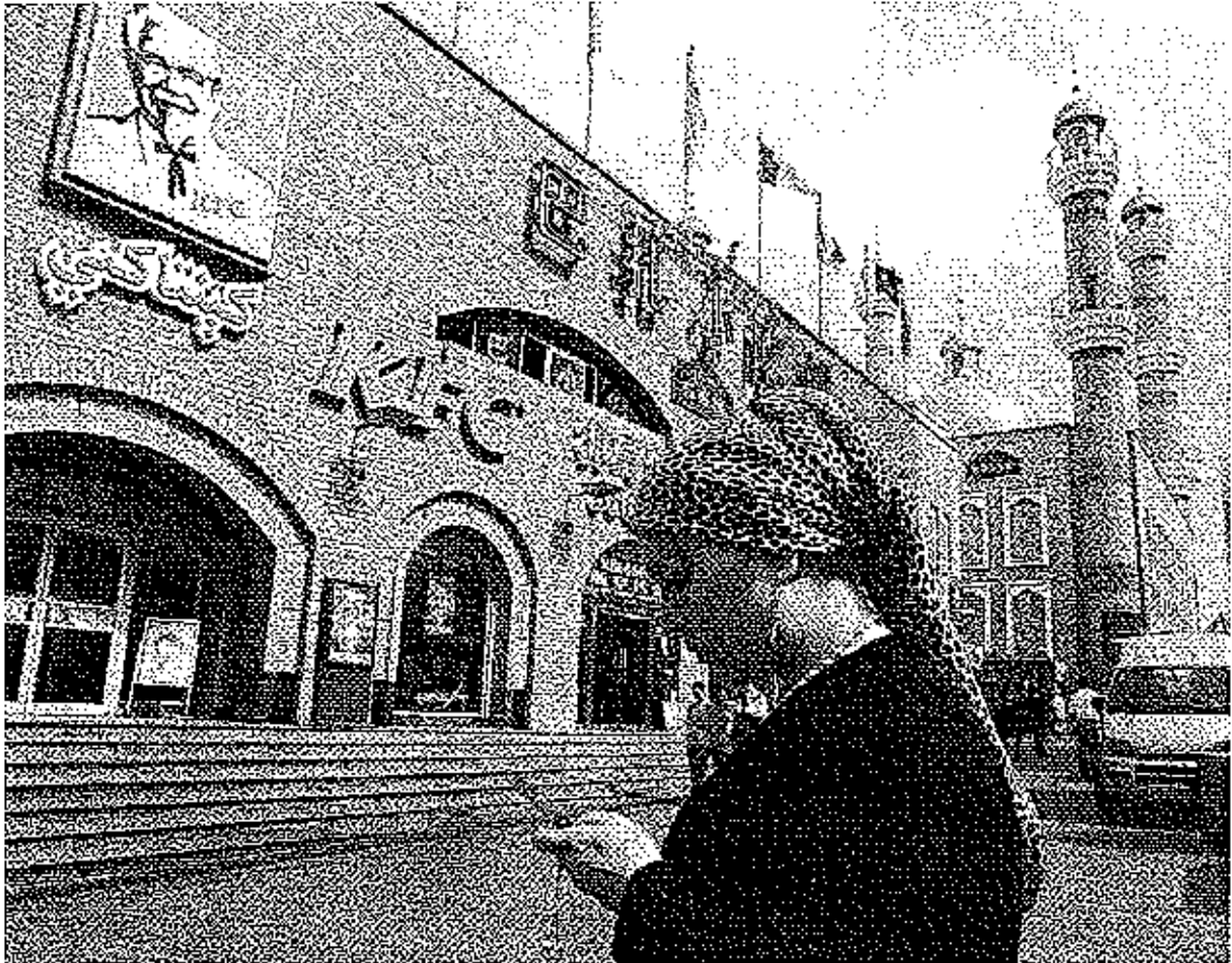
KFC : Kentucky Fried Chicken, chaîne de restauration rapide à base de poulet Source : Documentation photographique, dossier n° 8064, juillet-août 2008 « le défi chinois » Thierry Sanjuan.