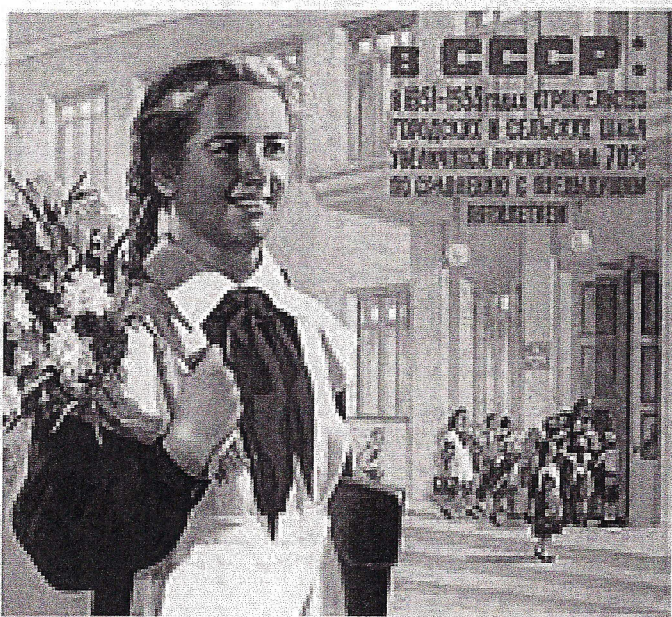
Dans l'Union Soviétique