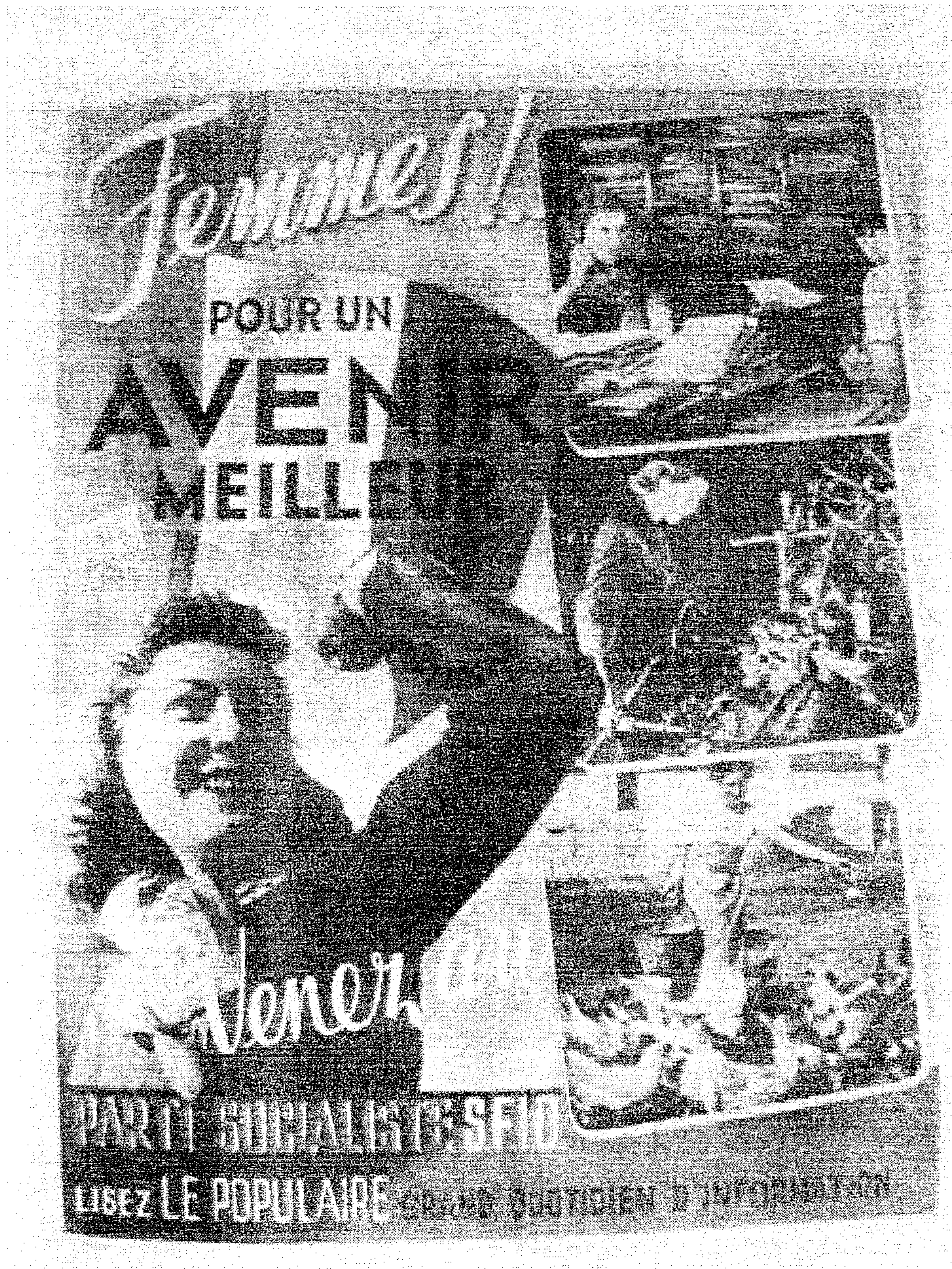
Source : Affiche éditée par le Parti Socialiste SFIO (Section Française de l'Internationale Ouvrière), 1945