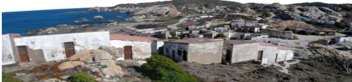
Los bungalós del Club Med antes de su deconstrucción.