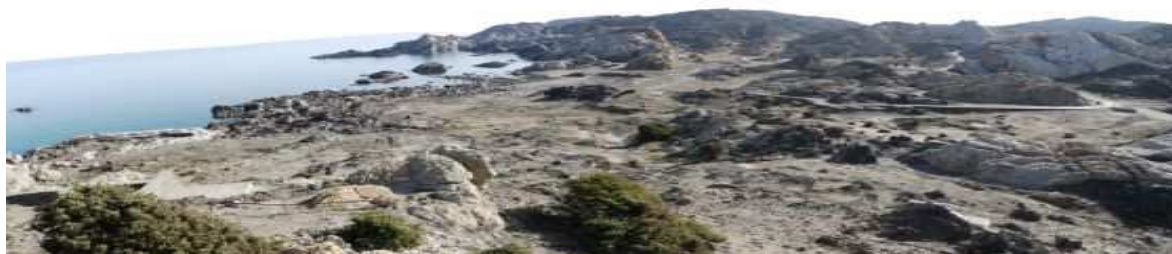
La misma vista tras eliminar los bungalós del Club Med.