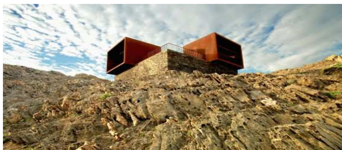
Un ejemplo de restauración creativa: el antiguo dispensario del Club Med se ha convertido en observatorio panorámico.

http://elsilenciero.com/2012/09/la-deconstruccion-del-club-med-gana-la-bienal-europea-del-paisaje/ 28/09/2012.