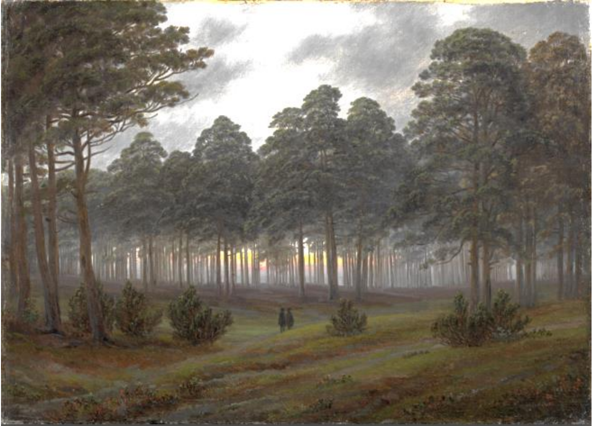
Caspar David Friedrich, Der Abend , 1821, 22cm x 30,5cm, Landesmuseum Hannover