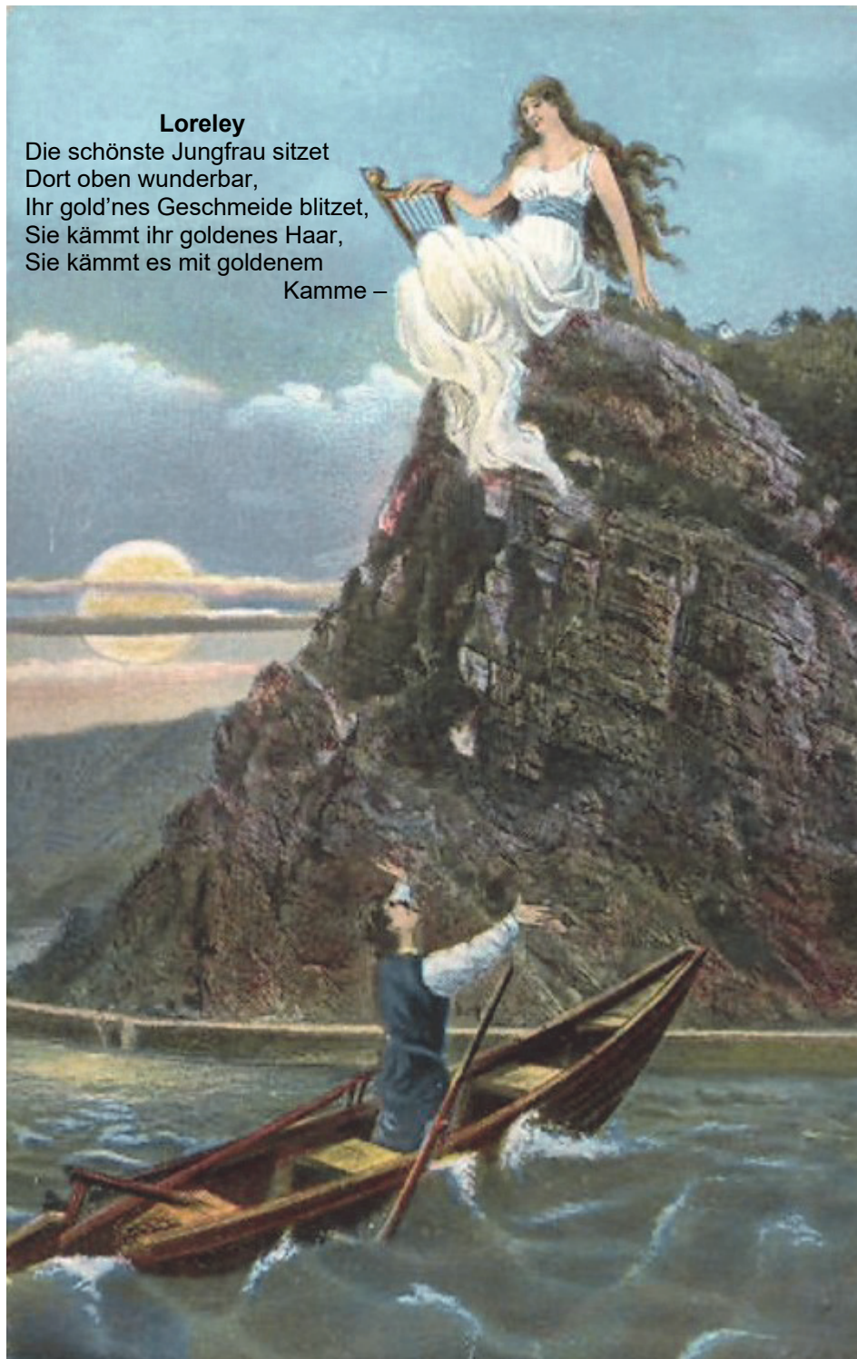
Die Loreley mit Leier auf dem Loreleyfelsen (Postkarte der Zwanziger Jahre)