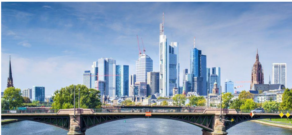
Skyline – Frankfurt am Main

Warum ist dieser Trend problematisch und was könnte man dagegen unternehmen? Argumentieren Sie und geben Sie konkrete Beispiele.