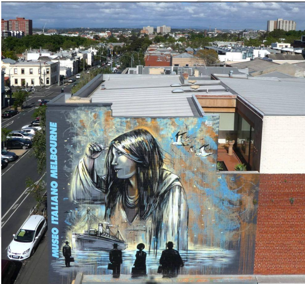
Alice Pasquini, Murales della speranza , Museo italiano di Melbourne, 2016

Osserva l'immagine qui sotto. Secondo te, permette di illustrare il testo di Laura Corso? Giustifica la tua presa di posizione.