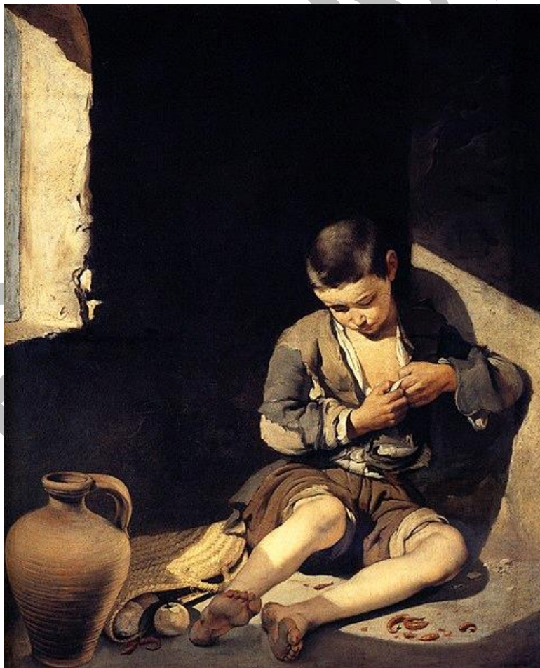
Bartolomé Esteban Murillo, Niño espulgándose , 1650.