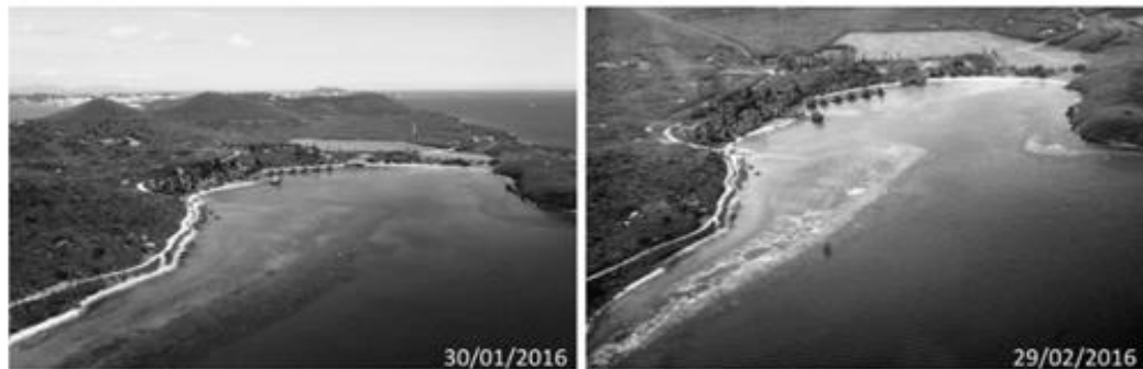
Figure 1 - Comparaison des deux vues aériennes de la baie du Kuendu Beach à Nouville, prises à la fin de janvier 2016 (à gauche) et à la fin de février 2016 (à droite) . Les tâches blanches visibles en 2016 correspondent au blanchissement massif des coraux.

En février 2016, la Nouvelle Calédonie a connu un épisode de blanchissement massif de ses récifs coralliens.